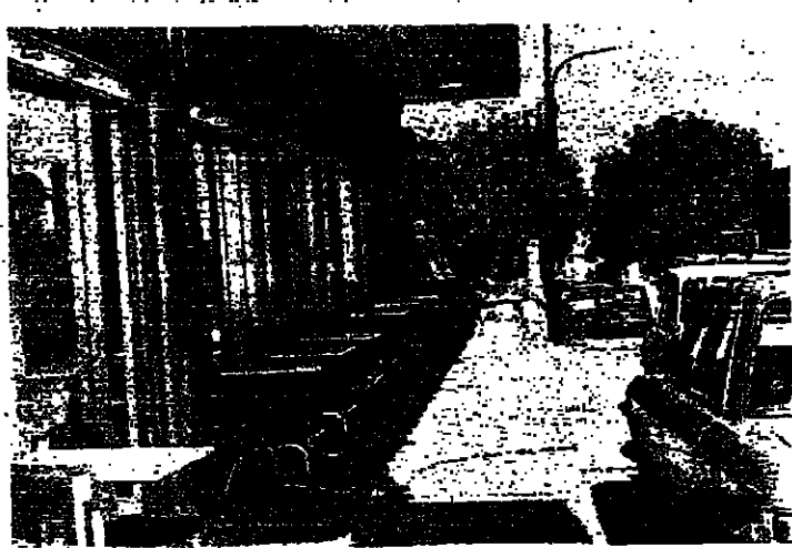
مقامي وصف حيلته بنظر زروادها

حراس بلدية طرابلس يطالبون بالبيعتهم الرسمية أو تمغنها طرابلس - من مكتب «الاتوار» : طالب حراس بلدية طرابلس ، في كتاب رنموه الى المسؤولين ، بالاعتراف الى بلدية طرابلس لاصطحاب الكتيبة أو دفع انتمائها القوية . ونكر الحراس وعدمهم ٦٠ حارساً انه قد مضى عليهم ثلاث سنوات دون ان تقدم البلدية لهم الكتيبة المقررة ، ان دفع لهم قيمتها اسوة برجال الاطفاء .